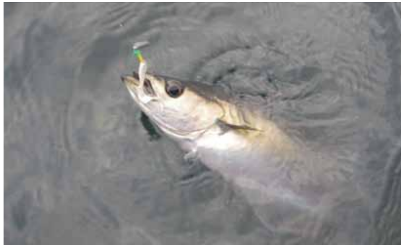
Het beste van twee werelden.

vangkracht ten volle kon bewijzen. Ten opzichte van ander kunstaas heeft het plankjeslood beslist diverse voordelen: het is zeker voldoende makreelbestendig, maar aan de ander kant vangt het op de juiste wijze gevist desgewenst ook veel makreel. Vanwege de hoog geplaatste haak raakte het in die week slechts éénmaal vast in de kelp, terwijl ik in diezelfde tijd aan andere montages een veelvoud aan onderlijnen en kunstaas zag verspelen. Je hebt geen hoge gewichten nodig om de bodem te halen, bijgevolg kan je met lichte hengels aan de slag en beleef je prima sport. Ik viste zelf nooit zwaarder dan 23 gram, en had zelden het gevoel dat ik gewicht te kort kwam. Met natuurlijk aas erbij krijg je een lokker die werkt, al moet ik nog nagaan hoe de inhakingskansen hierbij kunnen worden verhoogd. Dat hoop ik een volgende keer te kunnen doen. Daar het ganse gezin