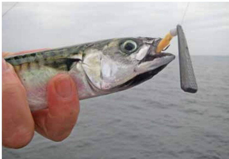
Je moest door de dikke laag hongerige makrelen heen eerst maar eens de bodem zien te bereiken.

Eenmaal vissend vanuit mijn kajak vormde dit in het begin ook wel een probleem. Telkens wanneer mijn loden driehoekje naar beneden dwarrelde, werd het onderschept en ik deed niet anders dan aantikken op deze gulzige scholenvis. Al gauw vond ik daarvoor echter een heel simpele oplossing: in plaats