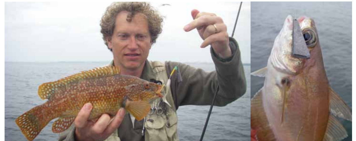
Gevlekte lipvis (links) en de overal aanwezige pouting (steenbolk).

Later die week hadden we de charterboot mv. Bundoran Star geboekt voor een avondje vissen in de baai.