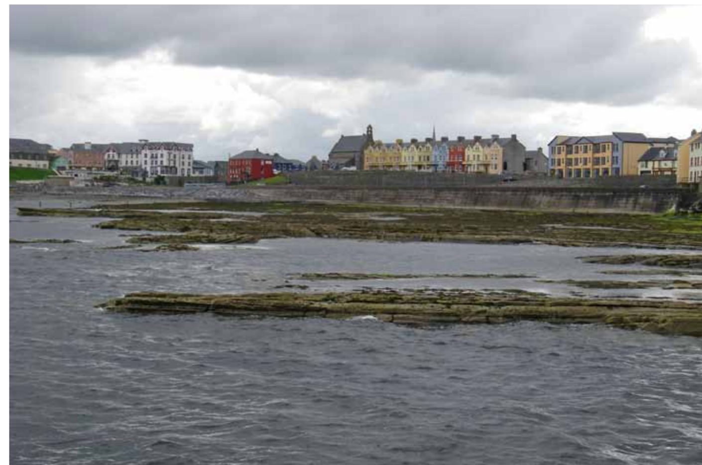
Het schilderachtige Bundoran ligt aan de Donegal Bay.

niet kennen, deze montage even kort te omschrijven. De basis is een plat loodje in de vorm van een gelijkbenige driehoek met afgeronde hoeken. In de hoek waar de gelijke zijden samen komen, is een gaatje geboord. De montage is verder