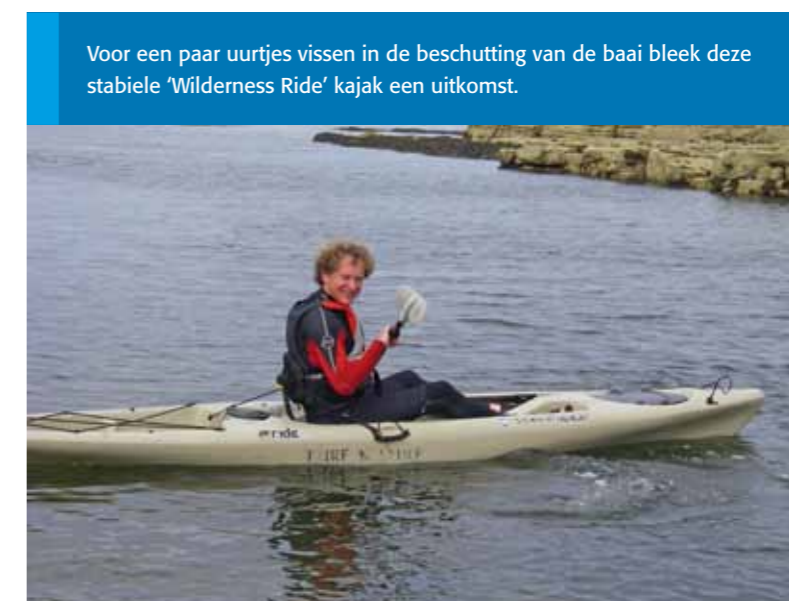
Voor een paar uurtes vissen in de beschutting van de baai bleek deze stabiele 'Wilderness Ride' kajak een uitkomst.